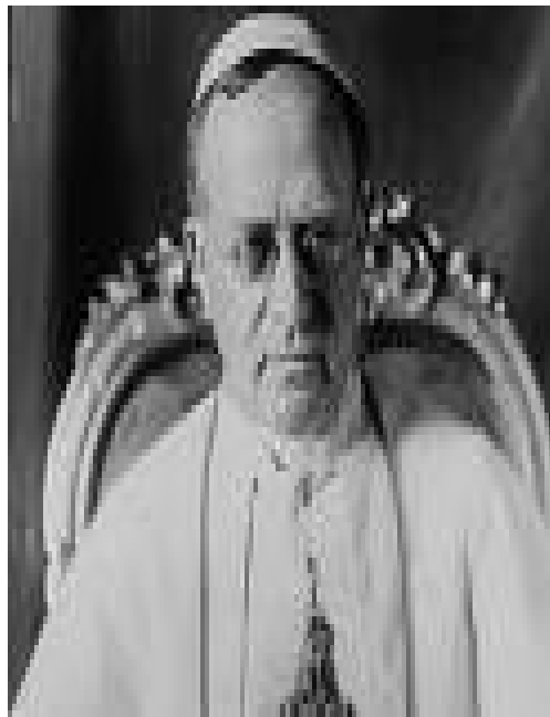
Papa Pio XI

Le operazioni politiche compiute dal fascismo al potere furono ben accolte dai poteri forti del Paese. Furono alleggerite le tasse sulle imprese, il servizio telefonico fu privatizzato, si limitò la spesa pubblica con un forte taglio di dipendenti statali. Qualcosa come 20.000 licenziamenti, soprattutto nella categoria dei ferrovieri. Inoltre il fascismo riuscì a ottenere i favori della Chiesa cattolica. Il papa Pio XI (che era stato nominato nel 1922) era un conservatore ed era soddisfatto del fatto che, col fascismo, il pericolo rosso era stato allontanato. Mussolini abbandonò, da parte sua, i toni anti-clericali che lo avevano in precedenza caratterizzato e promise al Vaticano importanti concessioni.